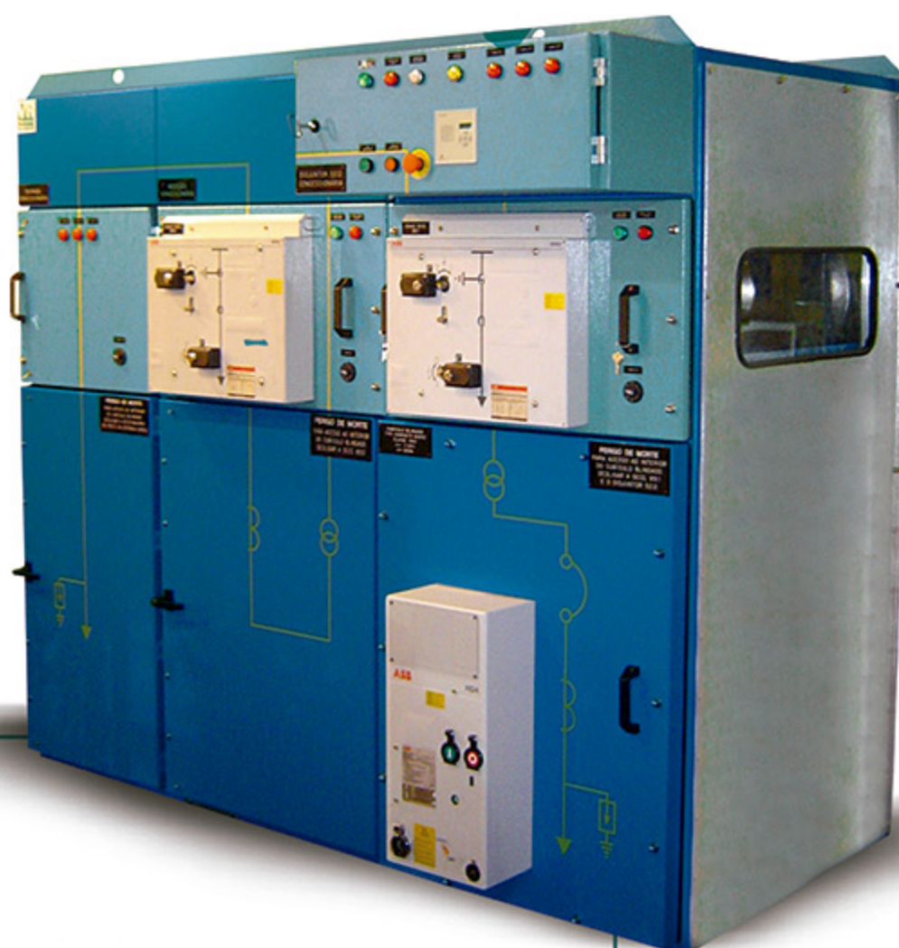
Cubículo Blindado 15KV Ensaiado conforme normas técnicas