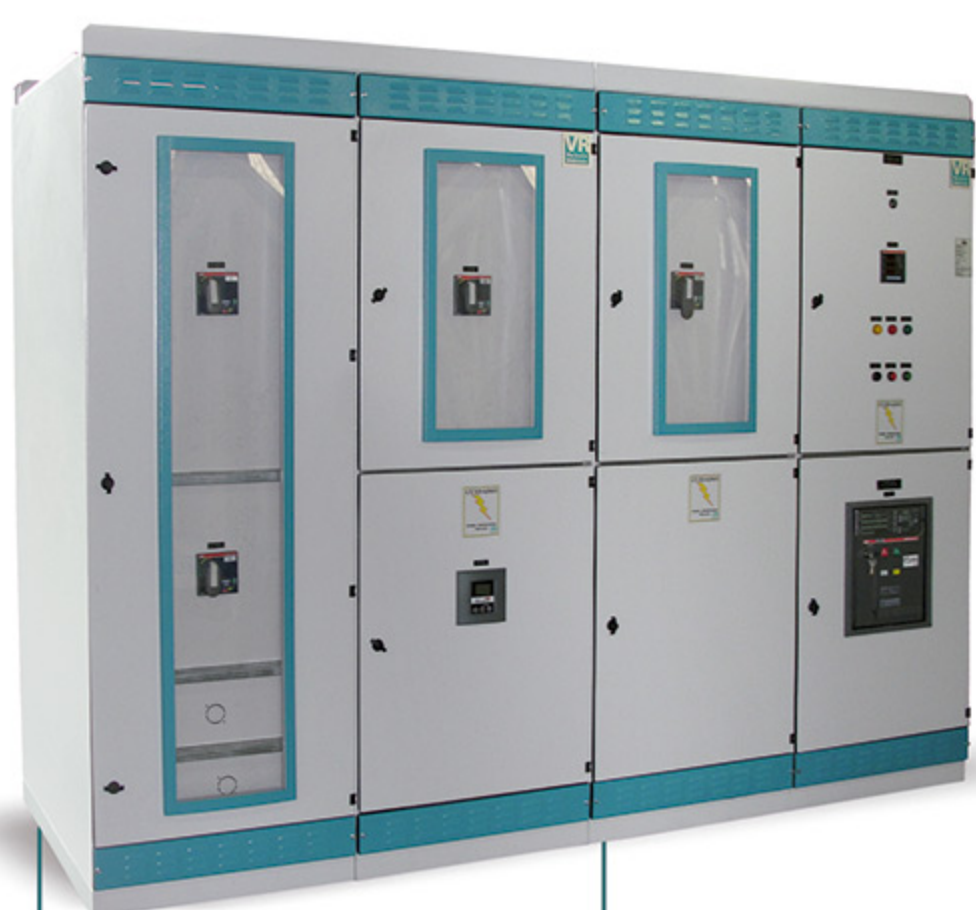
QGBT Forma 3B TTA/PTTA

Nossos produtos são certificados conforme as normas técnicas da ABNT de baixa tensão NBR IEC 60439-1 (TTA/PTTA) e Média Tensão NBR IEC 62271:200, passando por certificação em rigorosos laboratórios nacionais USP e CEPEL, proporcionando aos nossos clientes segurança, qualidade e a durabilidade.