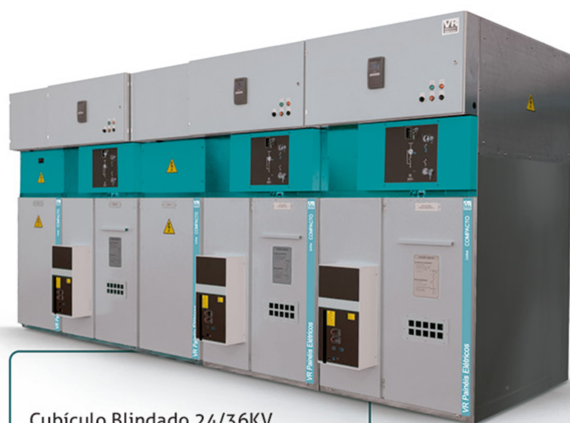
Cubículo Blindado 24/36KV Ensaiado conforme normas técnicas