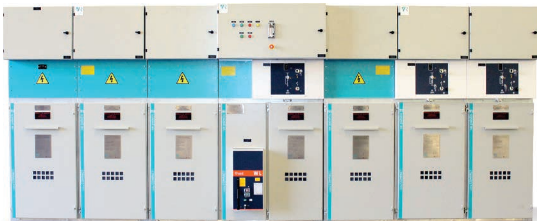
■ Vista frontal externa