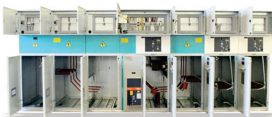
■ Vista frontal interna